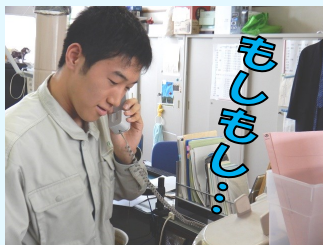
↑ 依頼者に事前に電話で打合せの予約をしています