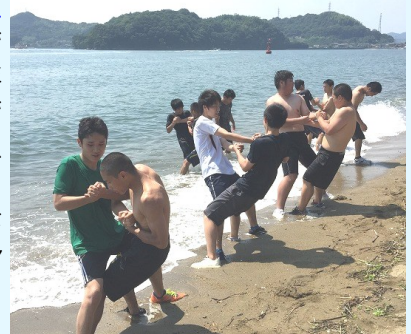
レスリング部の夏の練習です。

笠工の特徴は笠工テクノ工房や各種コンテスト、資格取得などにも表れている工業技術の高さです。そして、もう一つの特徴が部活動です。放課後には各種大会などに向けて、練習や準備を頑張っています。大会でいい成績を残すことも大切ですが、それ以上に 授業だけではなかなか身に付けられない能力を 養います。また、就職試験の時にも、よく部活動は重要視されます。所属している事に加えて、それ以上に どんな事を頑張ってきたかということが肝心 です。1年生は3年間続ける部活動です。よく考えて入部をしましょう。みんなで部活動を盛り上げて、楽しい笠工生活を送りましょう。